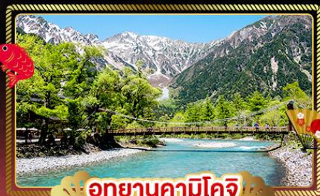
อุทยานคามิโคจิ